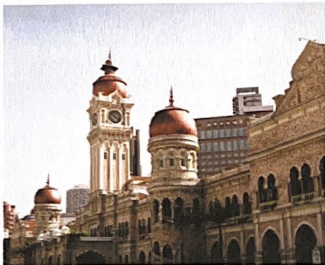
Bangunan Sultan Abdul Samad, Kuala Lumpur

Menurut Kamus Dewan Bahasa Edisi Keempat, monumen merujuk kepada bangunan yang dibina untuk memperingati seseorang atau peristiwa penting. Malaysia memiliki banyak monumen mengikut era yang tidak hanya mempunyai nilai komersial bagi memacu industri pelancongan tetapi juga menyuntik semangat patriotisme.