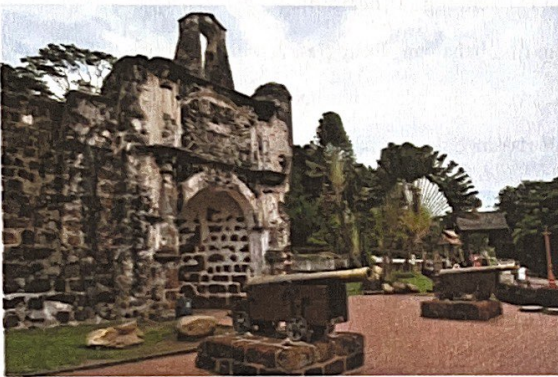
Kota A' Famosa, Melaka

Panjangnya huraian anda hendaklah antara 150 hingga 200 patah perkataan.