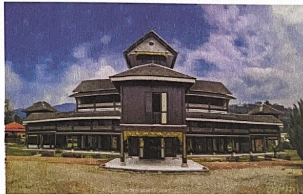
Muzium Diraja Istana Lama Seri Menanti, Kuala Pilah