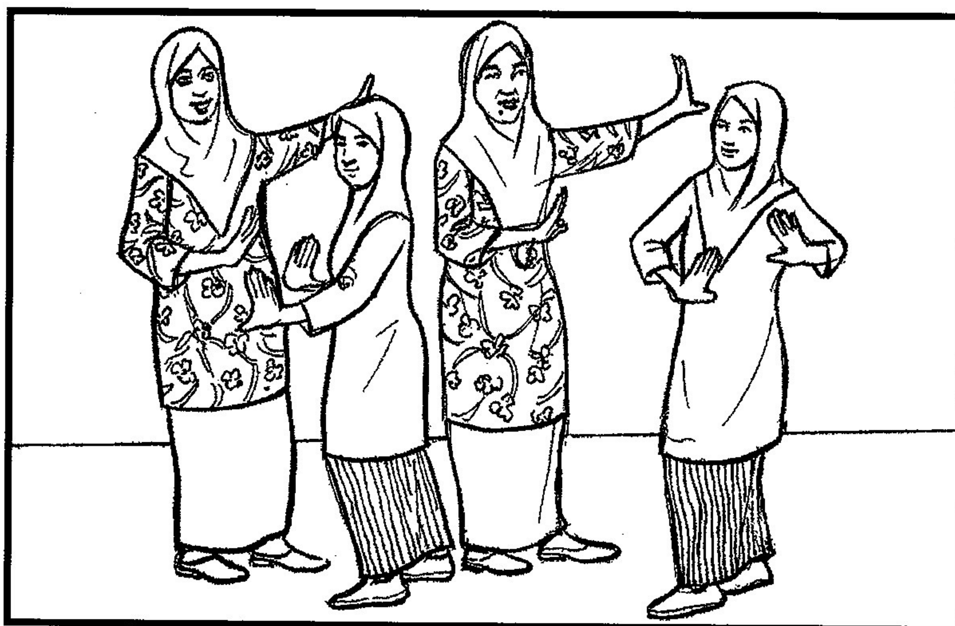
Mengeratkan hubungan dengan guru