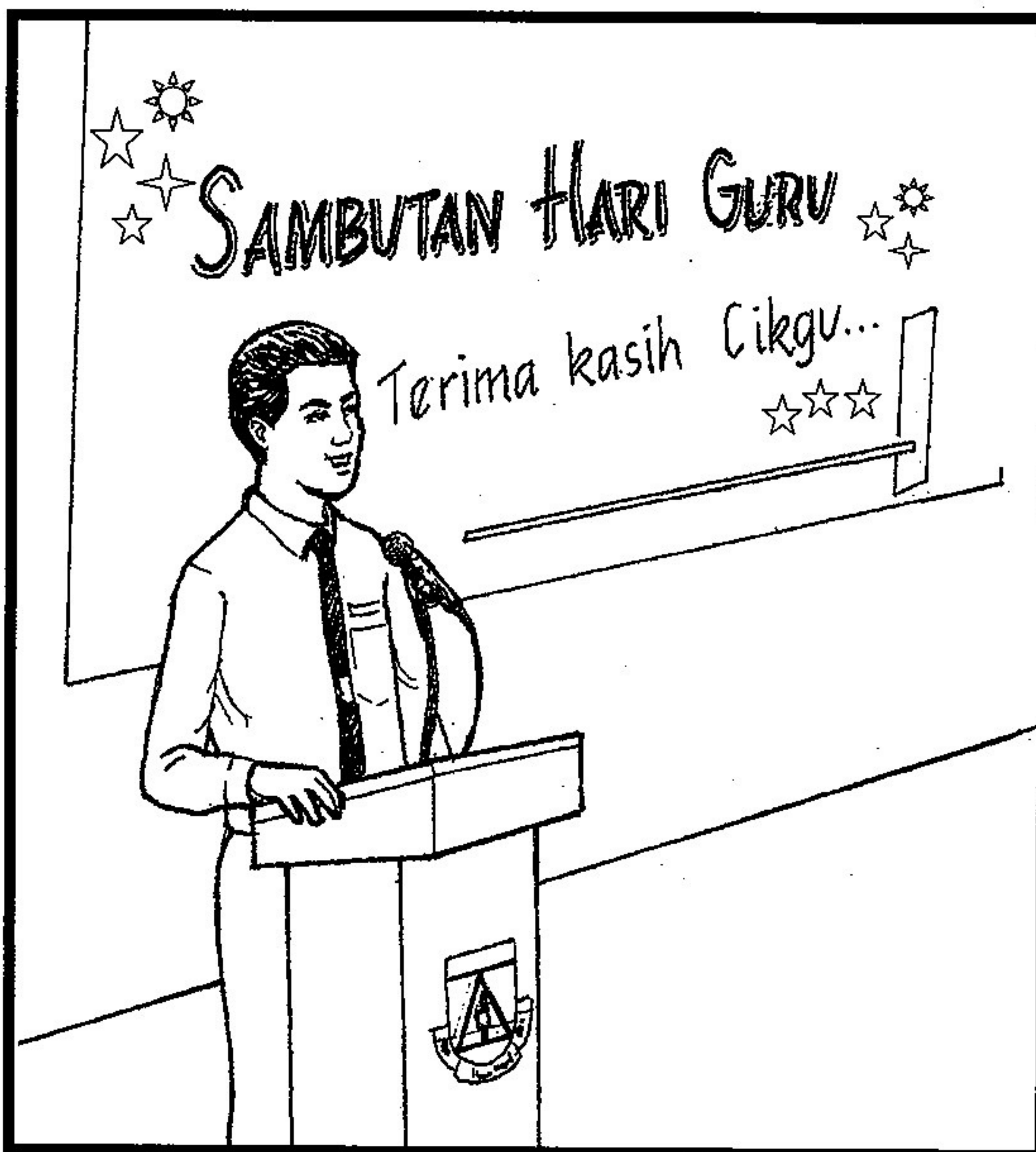
Menghargai jasa guru