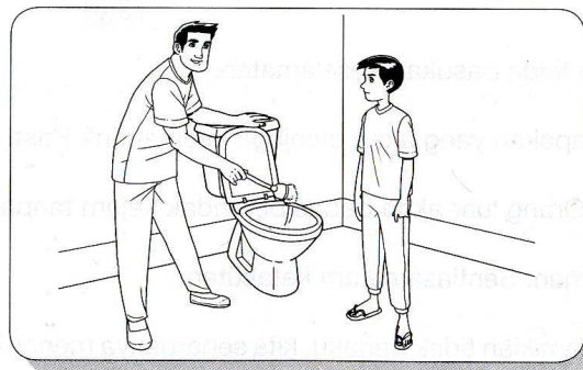
Ibu bapa memberikan perhatian dan didikan tentang kebersihan tandas