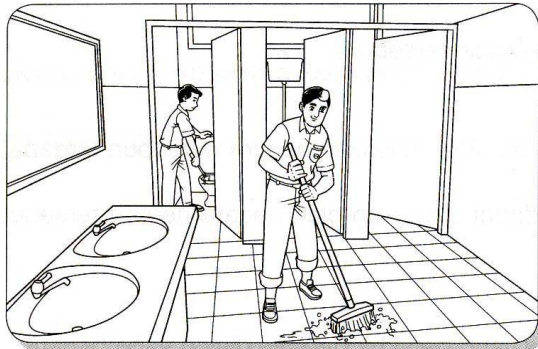
Aktiviti pembersihan secara berkala