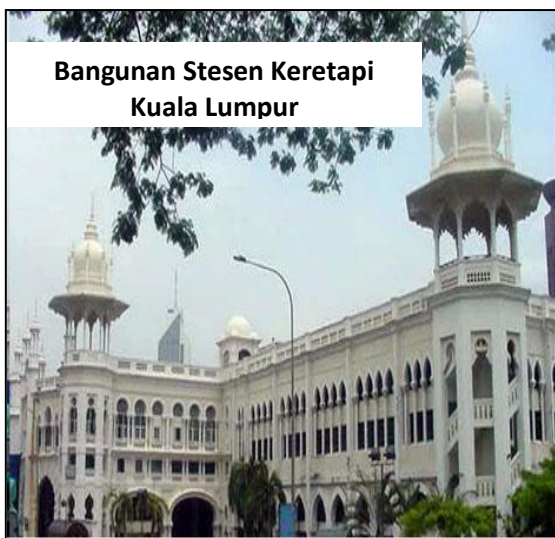
Bangunan Stesen Keretapi Kuala Lumpur