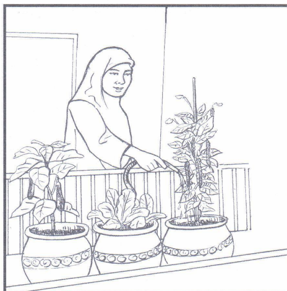
Menanam sayuran untuk kegunaan sendiri