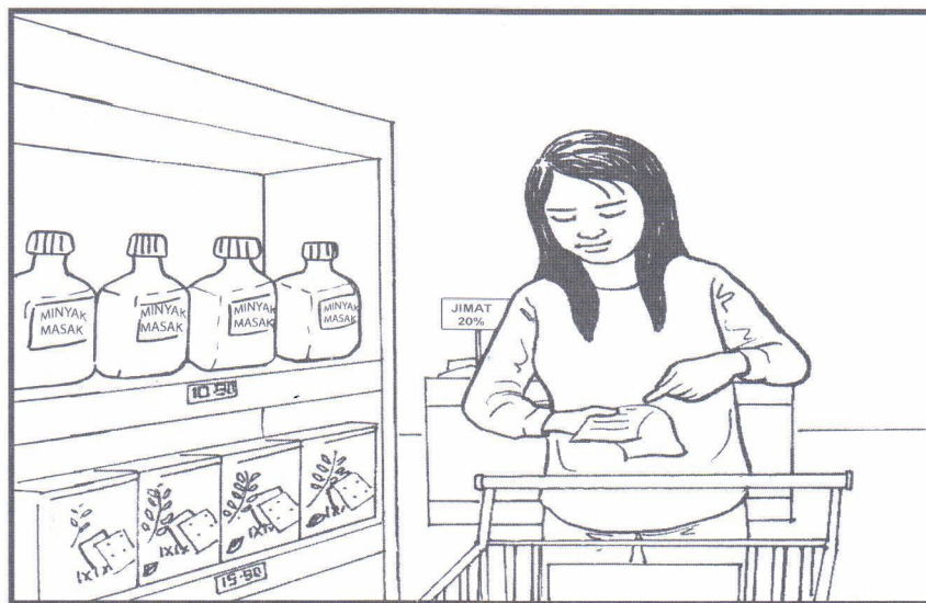
Menyediakan senarai barangan yang hendak dibeli