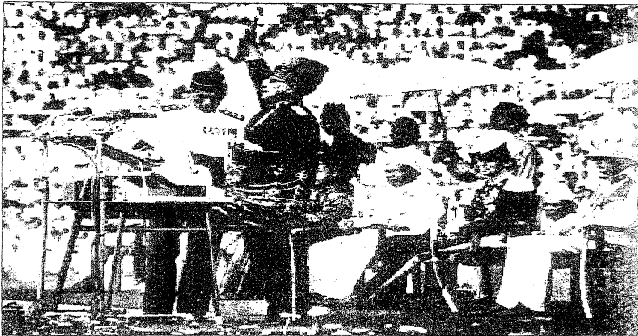
Memupuk Semangat Patriotik