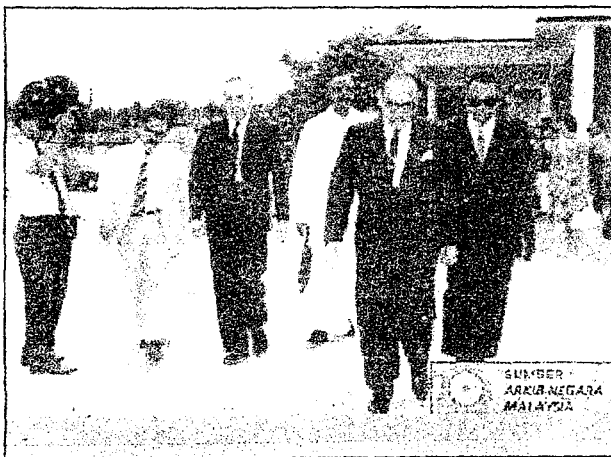
Menghargai Jasa Pemimpin