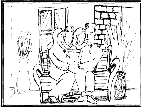
Ibu Bapa Menjadi Suri Teladan

Gambar rajah di bawah menunjukkan langkah-langkah untuk membudayakan amalan membaca dalam kalangan rakyat Malaysia. Huraikan pendapat anda tentang langkah-langkah membudayakan amalan tersebut dalam kalangan masyarakat. Panjangnya huraian hendaklah antara 200 hingga 250 patah perkataan.