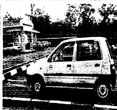
Memperketat syarat pengambilan lesen memandu