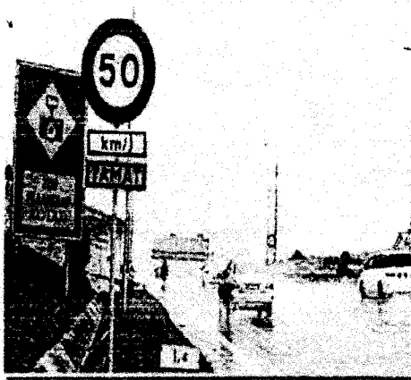
Mematuhi peraturan jalan raya