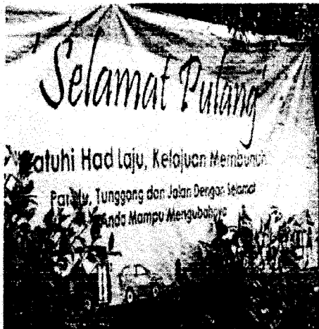
Kempen Keselamatan Jalan raya