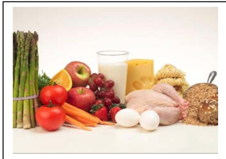
Makan makanan seimbang

Berdasarkan rajah di bawah, huraikan pendapat anda tentang kepentingan amalan gaya hidup sihat . Panjangnya huraian anda hendaklah tidak melebihi 120 patah perkataan .