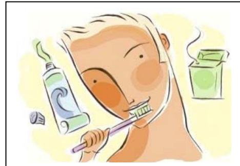
Menjaga kebersihan diri