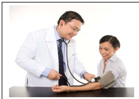
Membuat pemeriksaan kesihatan