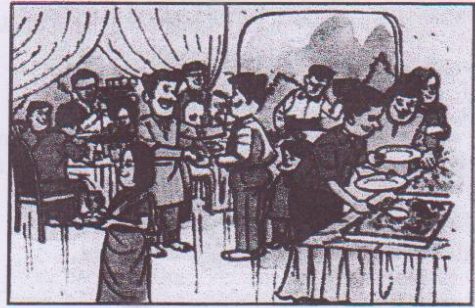
Penganjuran rumah terbuka