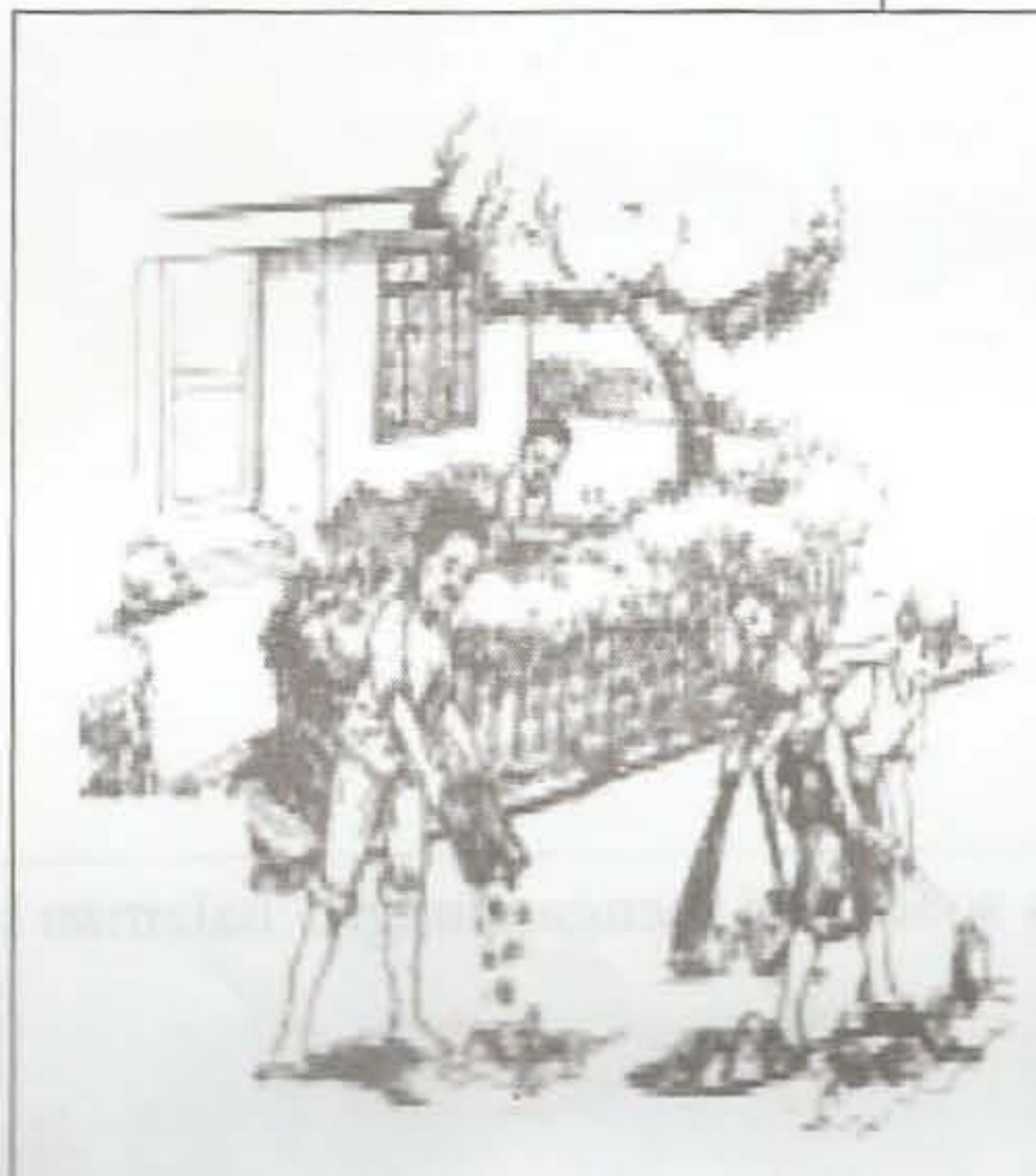
mengadakan program bergotong-royong