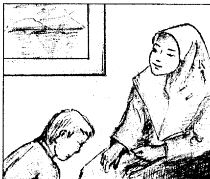
Menghormati Ibu Bapa